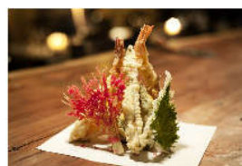
tempura mista di verdure e gamberi

Insieme alla cucina, l'ambiente sofisticato e il servizio accurato fanno di Finger's Porto Cervo uno dei ristoranti più cool della Costa Smeralda che quest'anno arricchisce la propria proposta con il servizio delivery per cene ed eventi privati in yacht e a domicilio.