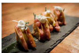
Millefoglie di Tonno con Pomodoro e Burrata