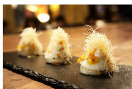
Taiyo & Luna_1a - © Francesco Mion